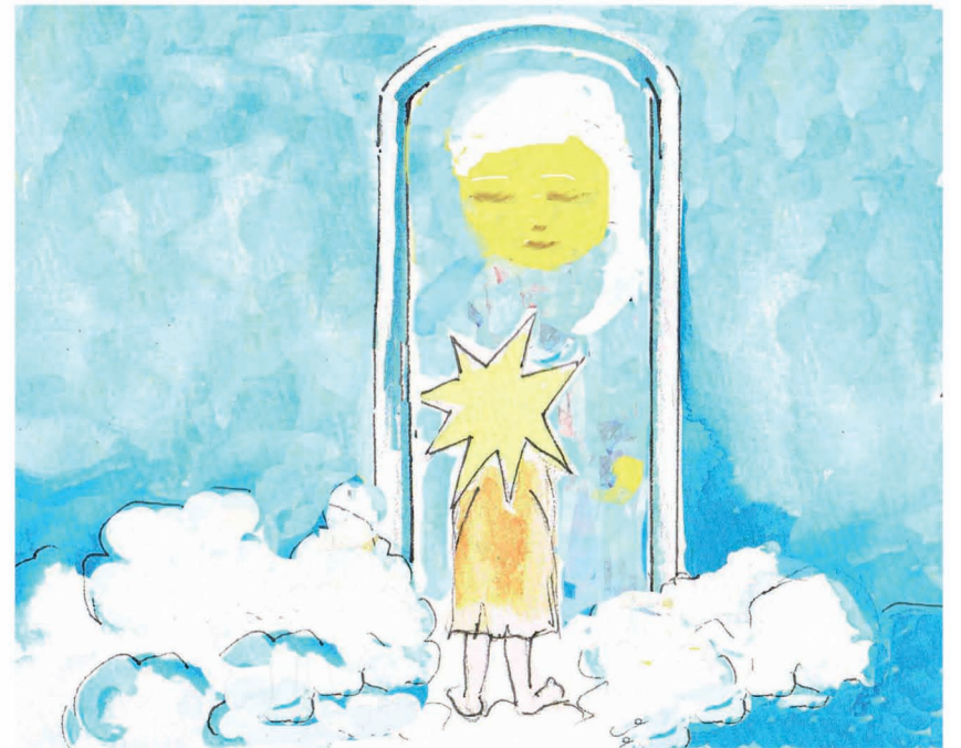
Illustration aus „Sonne, Mond und Märchen“, gezeichnet von Ly Fabian. Ein Stern klopft an bei der Sonne, als die verschlafen hat ...

Ihr könnt euch sicher vorstellen, dass Holz und Steine über viele Jahrhunderte unter Regen, Frost und Hitze zu leiden haben. Wird dann „renoviert“, man spricht auch von